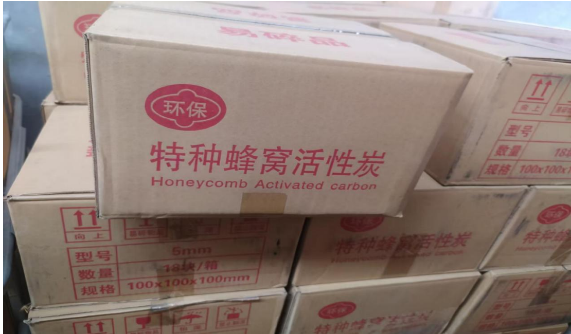
方案改造前用活性炭照片