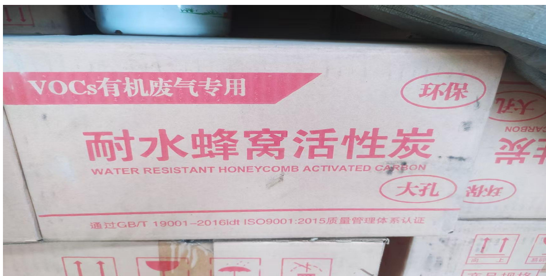
方案改造后使用活性炭照片